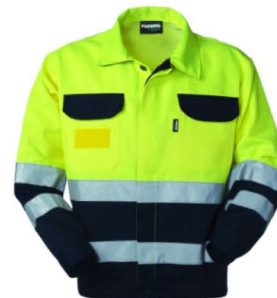
42 - GIALLO/BLU