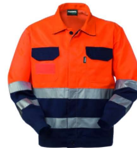
21 - ARANCIO/BLU