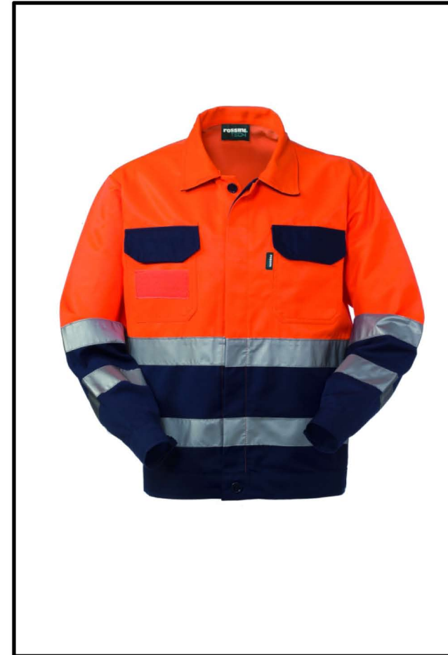
21 - ARANCIO/BLU