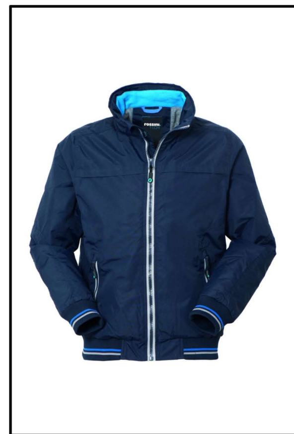
01 - BLU