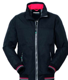
05 - NERO