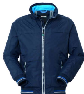
01 - BLU