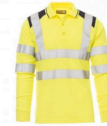
GIALLO FLUO/BLU NAVY