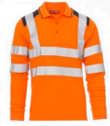
ARANCIONE FLUO/BLU NAVY