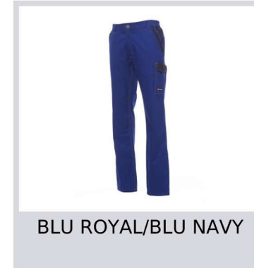
BLU ROYAL/BLU NAVY