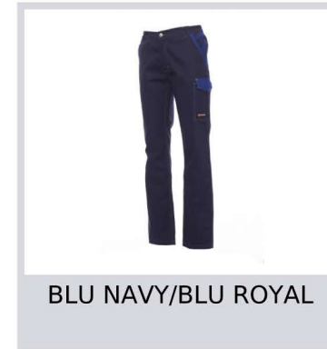
BLU NAVY/BLU ROYAL