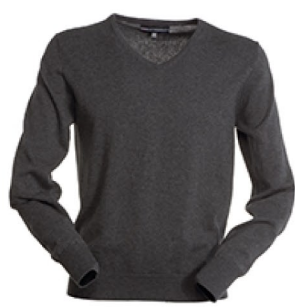
GRIGIO CENERE MELANGE