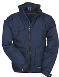
DRESS BLU NAVY/BLU ROYAL