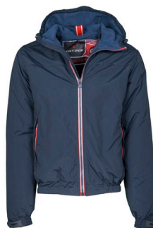
BLU NAVY/ cerniera in contrasto