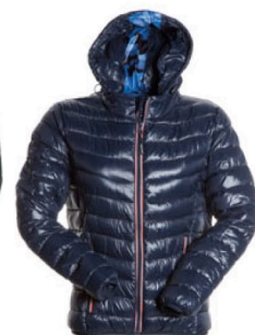
BLU NAVY/MIMETICO BLU