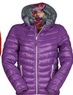
SUMMER VIOLET/G RIGIO/FIORATO