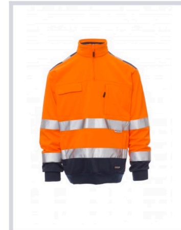
ARANCIONE FLUO/BLU NAVY