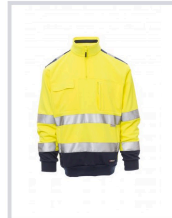
GIALLO FLUO/BLU NAVY