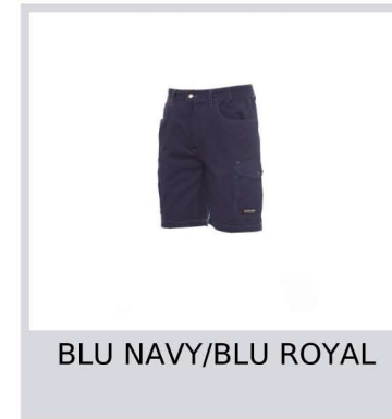
BLU NAVY/BLU ROYAL