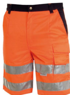
ARANCIONE FLUO/BLU NAVY