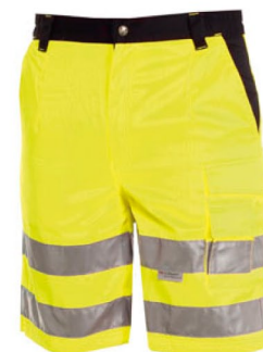
GIALLO FLUO/BLU NAVY