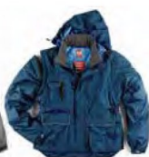
I0101B BLU NAVY