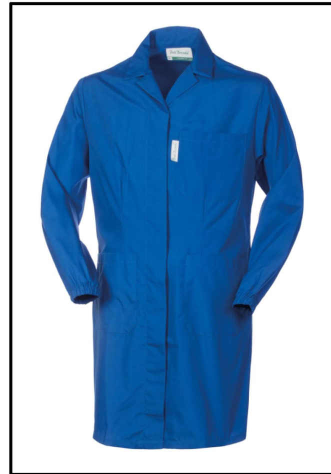
06 – AZZURRO ROYAL