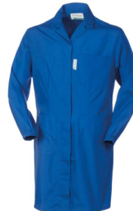
06 – AZZURRO ROYAL