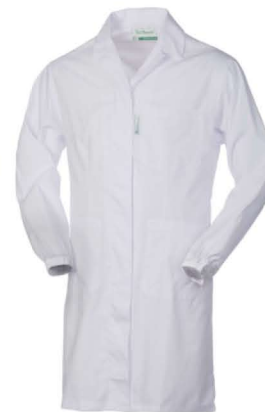
02 – BIANCO