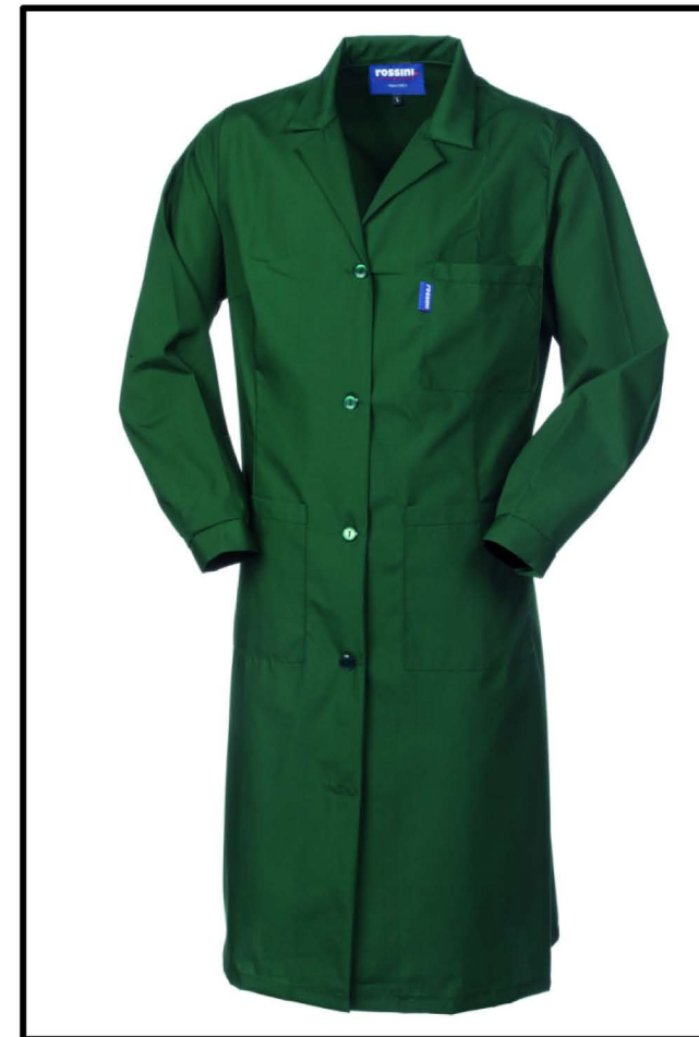
04 - VERDE