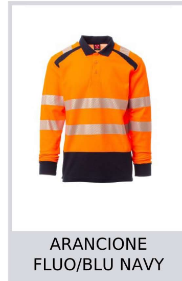
ARANCIONE FLUO/BLU NAVY