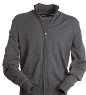
GRIGIO CENERE MELANGE