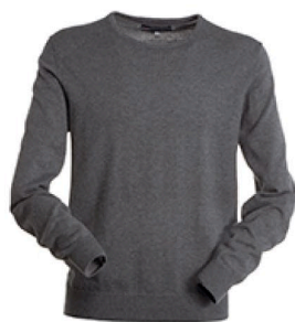
GRIGIO CENERE MELANGE